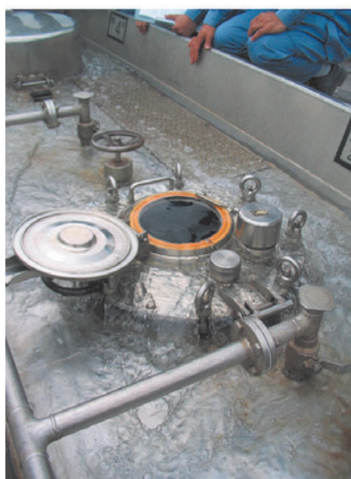
写真2 水を用いたオーバーフロー事故の再現